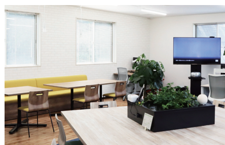
▲開放的なオフィス

当社は佐賀市に本社、武雄、唐津、伊万里、鳥栖に支店と営業所を置いていたのですが、2019年8月の大雨により武雄営業所が洪水被害に遭いました。武雄営業所の事業復旧には苦勞をしたのですが、経営陣がそれ以上に心配したのは、自宅が被災したにもかかわらずオフィスの復旧作業に従事する社員の計り知れない疲弊した状況でした。そこで社員が二度と同じ想いをしないよう、事業持続が可能な場所へのオフィス移転とワーク環境の変革を決意しました。移転先は元の武雄営業所と伊万里営業所の中間に位置する高台とし、西部支店と名前も改め、ワーク環境も一新してフリーアドレスとテレワークを導入することにしました。